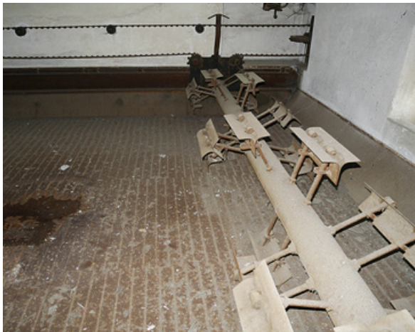
Obere Darre der Mälzerei mit Malzwender und durchlässigem Hordenboden. Hier wurde das Malz mit Warmluft getrocknet.

pachtung nicht mehr zu decken waren und vom Gesamtertrag des Gutes abgeschrieben werden mussten. Weitere Kosten für nötige Reparaturen verschärften die Situation, so dass wegen der hohen Abschreibungen von Erträgen im eigentlichen Sinn keine Rede mehr sein konnte. 1887 hielt man bei der Abfassung der Wirtschaftsrechnung für das Gut Berthelsdorf fest, dass die Kundschaft der Brauerei sehr abgenommen und in Folge dessen sich der Betrieb nicht unbedeutend verringert hat. Der jährliche Pachtzins betrug ab 1870 900 Mark und sank bis 1890 wegen schlechten Geschäftsgangs auf 750 Mark. Da sich die Direktion der Brüdergemeinde in den Pachtverträgen die entschädigungslose Lieferung der anfallenden Treber und Malzkeime für die Viehwirtschaft auf dem Gut sowie für Deputatbier abgesichert hatte, wurden neben der Pachteinnahme noch ca. 1.500 Mark jährlich zu den Einnahmen der Brauerei zugerechnet. Das deckte gerade die Ausgaben für Reparaturen. Die hohen Abschreibungen nach 1872 für den Eiskeller und den Umbau der Malzdarre fehlen freilich in dieser Rechnung und machten bei realistischer Berechnung die Brauerei zum Verlustgeschäft.