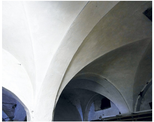
Gewölbedecke im Braulokal. Sie wurde 1852 neu gewölbt.

Nach der Inbetriebnahme zeigten sich nicht nur durch die Notwendigkeit neuer tieferer Bierkeller Mängel in der Konstruktion und Zweckmäßigkeit des Brauhauses. 1817 stürzte das Gewölbe im Vorkeller ein, weil die Ziegel durch eindringende Nässe aus dem Brauhaus mürbe geworden waren. Ein Jahr später mussten einige Fensteröffnungen zugemauert werden, weil die Festigkeit des Gebäudes beeinträchtigt war. 1821 musste die Malzdarre für 350 Taler erneuert werden. Ein misslicher Umstand für das Bierbrauen waren die zu niedrigen Gewölbe im Brauhaus. Gerade im Sommer kühlte dadurch das abgezogene Bier in den Kühlschiffen nicht schnell genug aus und so verdarben trotz größter Mühe immer wieder ganze Gebräude. Als unverhältnismäßig im Vergleich zu den anderen Brauereien der Brüdergemeinde wurde immer wieder der hohe Holzverbrauch angegeben. 1830 musste eine neue Braupfanne angeschafft werden und 1831 wurde nach nur 25 Jahren das Dach der Brauerei umgedeckt. 1842 wurde erstmalig neben Holz auch Braunkohle für Feuerung in der Brauerei eingesetzt, ab 1845 für das Darren nur Braunkohle. Gleichfalls wurde in jenem Jahr ein Braukessel durch eine Braupfanne für 800 Taler ersetzt. 1852 erfolgte ein Umbau des Gewölbes im Braulokal, dessen Kosten sich auf 674 Taler beliefen. 1858 ergaben sich Ausgaben von etwa 1000 Talern für einen Umbau der Malzdarre und eine Reparatur der Braupfanne.