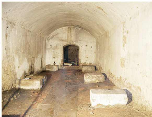
Vorderer Bierkeller in der unteren Etage von 1812. Die Kellersohle liegt fast neun Meter unter dem Gelände.