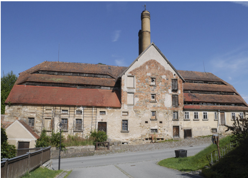
Ehemalige Brauerei und Mälzerei. Am Zwerchgiebel ist die Aufstockung der Darre aus dem Jahr 1940 noch gut am Putz zu erkennen.

Die Umbaumaßnahmen begannen im Juni 1940. Zwei Maurer und ein Arbeiter errichteten in sechs Wochen einen neuen Abluftkamin (Darrfax) sowie einen Heizungsschornstein. Dazu musste nach dem Abriss des baufälligen alten Darrfaxes der alte Zwerchgiebel deutlich über den First des Daches erhöht werden. Die Umbaumaßnahme ist auch heute nach über 85 Jahren noch deutlich am Mauerputz erkennbar.