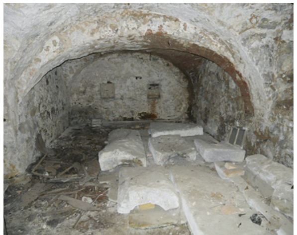
Einer der alten Bierkeller von 1806 unter dem Braulokal. Diese waren ungeeignet für die Lagerung von Bierfässern.

»Außerdem, dass der Luftzug das Gebäude, wenn es so zu stehen kommt, überall frei quer durchstreichen kann, schafft diese Stelle noch den Vorteil, dass die Abfahrt des Bieres ganz von der Außenseite geschehen kann, und folglich die Bewohner des Herrenhauses solchergestalt weniger durch das Geräusch der Ab- und Zugehenden, und wenn zur Nachtzeit gebraut wird, Beschwerde erleiden; so wie ferner, dass der Holzvorrat besser umschlossen und verwahrt werden kann. Nach Versicherung des Maurermeisters ist übrigens für die Haltbarkeit der Mauern, obgleich nicht weit davon hinauswärts das Terrain tiefer ist, einige Gefahr nicht zu besorgen, und kann überdies solche Vertiefung durch den vom Ausgraben der Keller zu erlangenden Erdboden etwas aufgefüllt werden.«