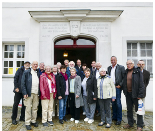
Mitgliederversammlung, Mai 2025

gehören derzeit 138 Mitglieder, 120 wohnen davon in Deutschland, ungefähr ein Drittel in der Oberlausitz. Für die meisten von ihnen ist Zinzendorf ein Begriff. Andere sind von unserer Arbeit begeistert. Da wir uns vor 27 Jahren gründeten, sind viele im fortgeschrittenen Alter. In unserem Vorstand sind wir zu acht, unser Altersdurchschnitt beträgt 72 Jahre. Zu Veranstaltungen und Aktionen und verschiedenen Arbeiten unterstützen uns auch Jüngere. Ohne ihr Engagement könnten wir vieles nicht leisten. Dafür sind wir auch sehr dankbar. Aber es ist dringend nötig, dass sich unser Vorstand verjüngt. Alle Vorstandsmitglieder zeigen einen hohen Einsatz, sonst könnten wir auch nicht für die Öffentlichkeit so präsent sein.